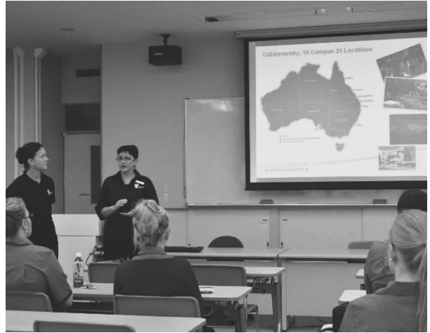
写真2 CQUの紹介講演会