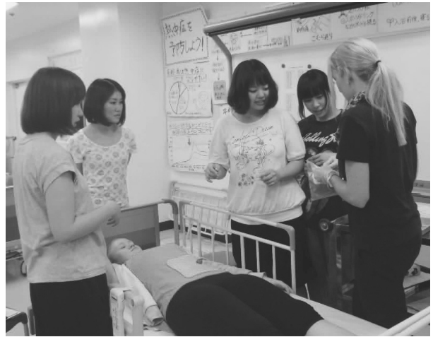
写真4 患者役と看護師役も体験