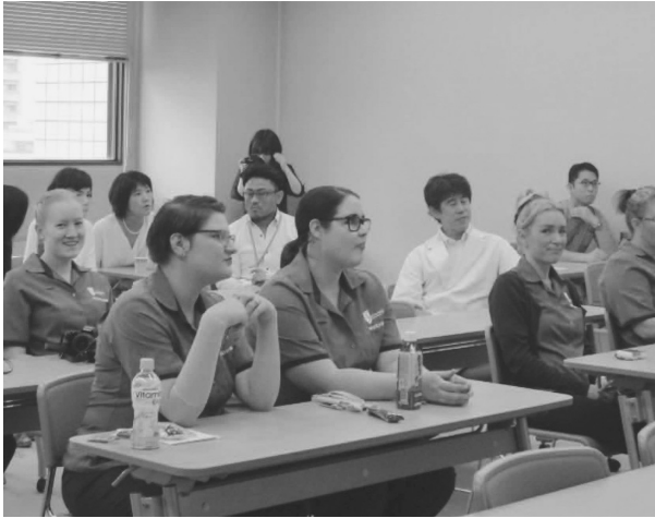
写真1 講演会での研修生たち