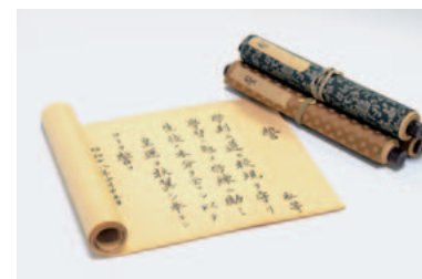
▲名古屋市立女子高等医学専門学校入学生「誓」

名古屋市立大学の前身校から今日に至る歴史について、新たに発見された公文書、キャンパス図面など大学のあゆみを語る資料を展示しています。