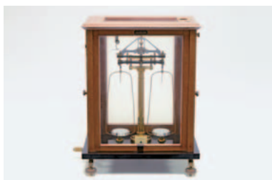
▲薬学部前身校時代から使用された天秤

大学に所蔵される学生生活に関する資料を展示するとともに、卒業生の皆様から寄贈された思い出の品々を展示しています。