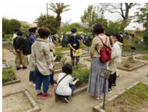
薬用植物園市民公開講座