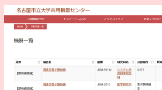
予約システムのイメージ