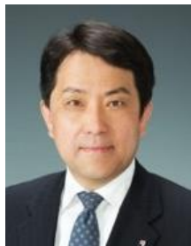
学長補佐（共用機器）