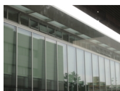
自然換気システム