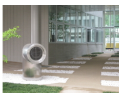
室外のクールチューブ(吸込み)