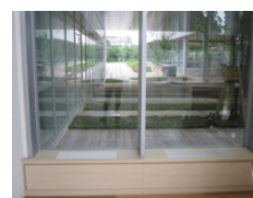
室内のクールチューブ(噴出し)