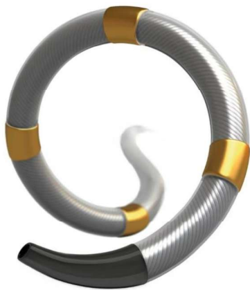
Simplicity Spyral 腎デナベーションシステム 医療機器承認番号：30700BZX00207000