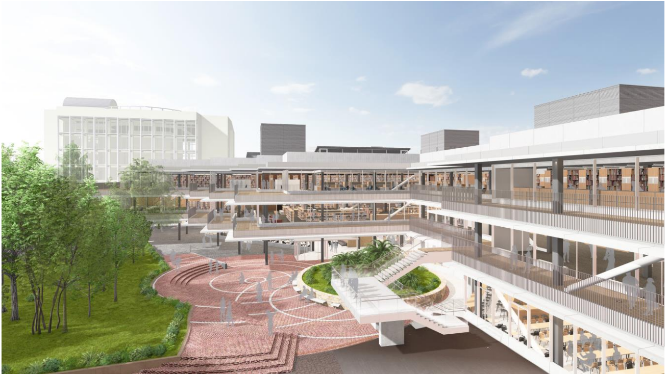
完成予想図（北側より）