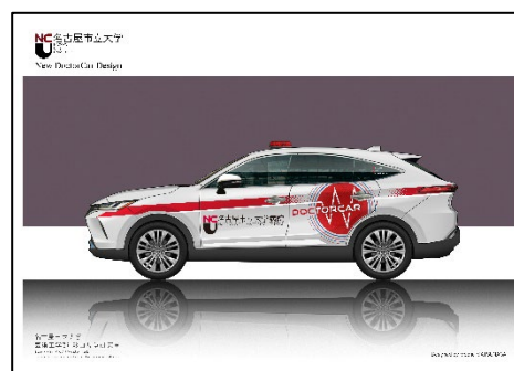
（10月から運用開始予定）