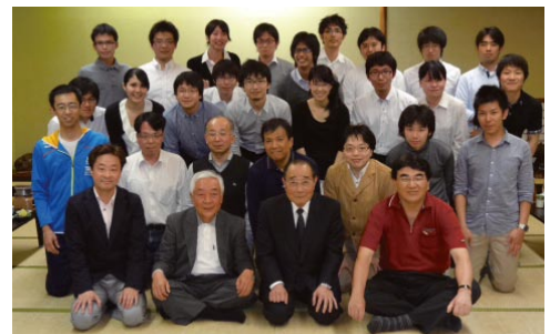
大学OB会懇親会 3教授に出席頂きました