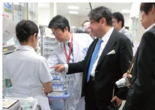
プロジェクトメンバーによる院内ラウンドの様子

プロジェクトを進める中で、改めて病院の中を観察してみると、医療機器の中には何十年も前から形を変えず利用され続けているものも見受けられます。例えば、気管挿管用の喉頭鏡やアンビューマスクなども以前からほとんど同じ形状のものが使われ続けています。革新的な高度医療機器の研究開発はもちろん重要ですが、一方でこれらの言わば「ガラバゴス化」した医療機器等をリデザイン、リニューアルして、医療従事者にとっても患者にとっても、より使いやすく負担が少ないものにしていくことも、医療のクオリティを向上させるために重要な視点であると考えています。