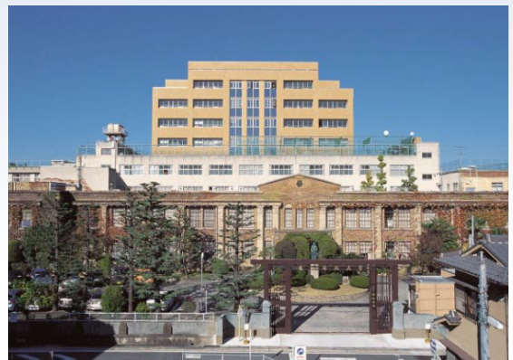
愛知学院大学薬学部棟

しかし、順風満帆とは参りません。ご存知の如く、政府は一般用医薬品の原則ネット販売解禁を決めました。薬の安全性・安心感を確保するため、教育現場では患者さんとのコミュニケーションの重要性を謳い、またお薬手帳や6年制薬学部の認可、登録販売者制度の導入など、適正使用や副作用の防止・早期発見に力を注ぎました。その意味では今回の決定は困惑気味です。学生はいたって勤勉にして真面目。医師の間ではやや認識不足かも知れないこの6年間に習得する半端でない膨大な知識と技能を、医療界全体としていかに活用するのができるのか…。これは医療レベルの国力につながる問題ではないでしょうか？ 医学を牽引する先生方お一人お一人のお力添えが何よりの解決策と確信しております。