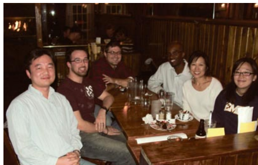
研究室の同僚と、アイオワシティ内のバーにて