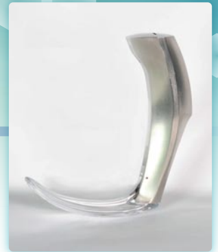
メディカルイノベーション プロジェクトから生まれた喉頭鏡

アベノミクス成長戦略では医薬品、医療機器、再生医療製品を日本の成長産業として育成することが謳われています。中でも医療機器について言えば、ものづくりが盛んな中部地域においては多くの医療機器メーカーや部品メーカーが存在し、2009年度の工業統計によると医療機器部品出荷額では愛知県は全国首位になっています。しかし国内で使われる医療機器にはまだまだ海外製品が多く、日本製医療機器は十分なシェアを持つに至っていないようです。その背景には、厳しい規制等による製品化までの大きなリスクや専門の人材の不足などの課題があるようです。実際に医療機器を開発する企業と接してみると、企業側から見ると医療機関との連携には高いハードルがあることです。現場のニーズにマッチした製品開発のためには医療機関と開発企業との密接な連携が必要不可欠です。しかし、現実には医療機関側にもこのことを十分に理解している人材が不足しています。