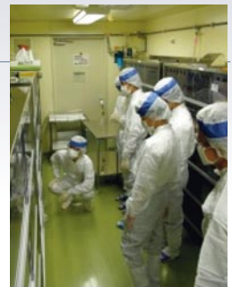
専用の着衣に着替え、実験動物を観察しました

名古屋市立大学に対する高校生・受験生の理解を助長するために、従前より、オープンキャンパスや出張講義等を開催しております。来年度以降、名古屋市立大学と名古屋市立高校との高大連携をさらに拡充・推進するために、医学部で行われる高度な教育・研究に触れることにより生徒の学習意欲の向上をはかり、また、進路選択の一助になることを目指して、体験学習の機会を広く名古屋市立高校に提供することが検討されています。