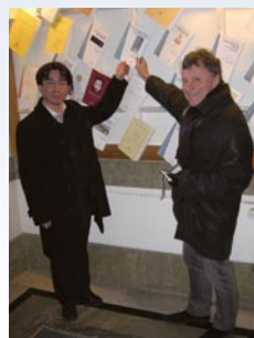
spika(公開審査のためthesis bookを掲示)