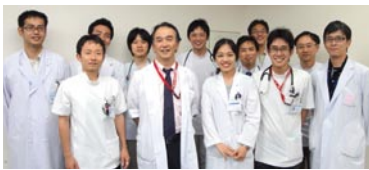
お世話になった腫瘍・免疫内科学の先生方と

名古屋市立大学付属病院での1ヶ月の経験は私にとってとても素晴らしいものでした。医療に関する知識が学べただけでなく、日本と韓国の医療システムの違いや患者さんへの対応、様々な状況を取り切る方法などについても学ぶことができました。私にとって初めての留学で、しかも日本語が全く話せなかったため、最初の頃はとても緊張していました。しかし優しい先生方や親切な学生さんたちに恵まれて、4週間後には本当に幸せな気持ちになりました。彼らがいつも助けてくれたので、日本での勉強や生活になじむことができました。